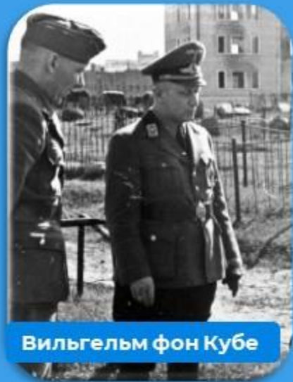
Вильгельм фон Кубе